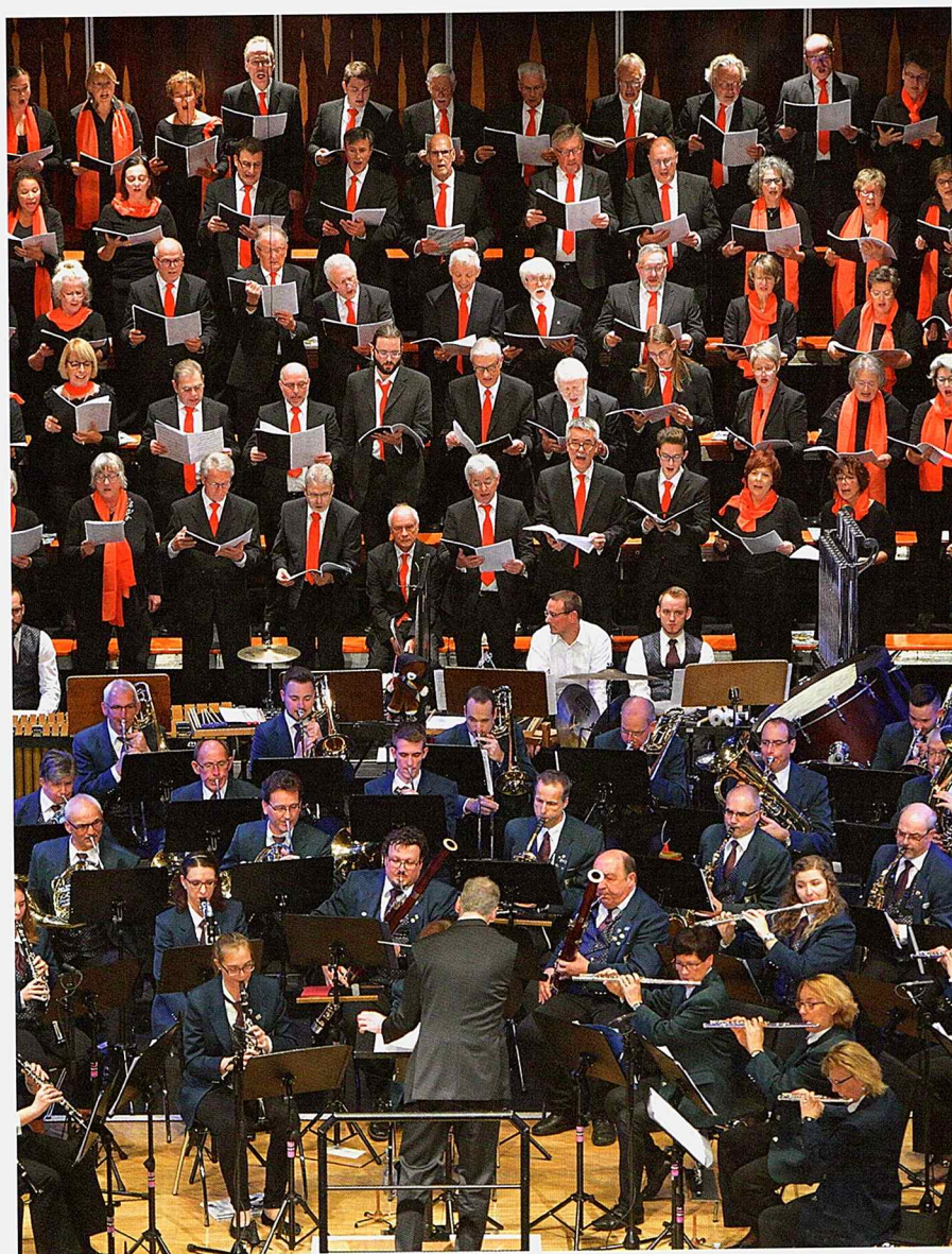
Mit „Blas-Chor-Musik“ wagte der Madrigalchor Singen mit 80 Sängern und 60 Musikern des Blasorchesters der Stadt Singen ein äußerst gelungenes Experiment.